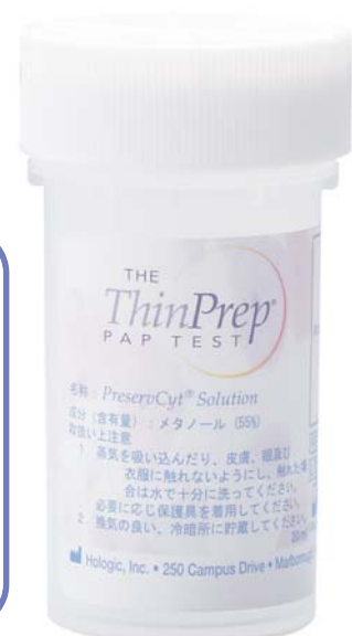
ThinPrep® プレザーブサイト液20ml