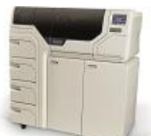
ThinPrep® 5000 プロセッサ AutoLoader