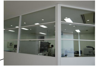
機器設置スペース※BSL-2レベル