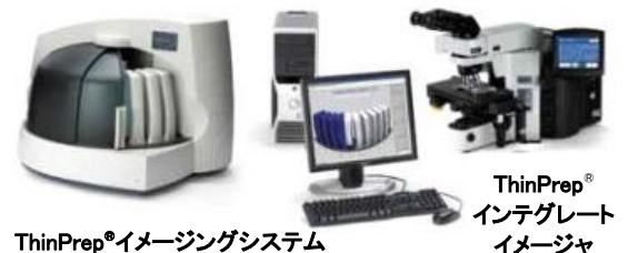
ThinPrep® イメージングシステム

(販売名: ThinPrep® インテグレート イメージャ、届出番号 13B1X10179001003)