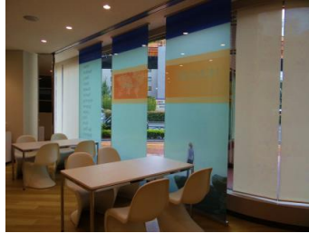
ラウンジスペース