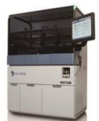
パンサー™システム